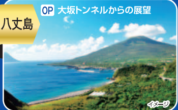
OP 大坂トンネルからの展望