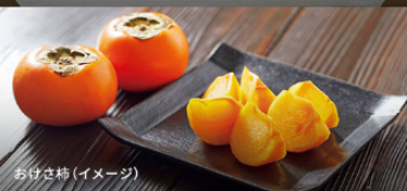
おけさ柿(イメージ)