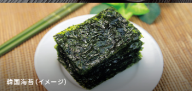
韓国海苔(イメージ)