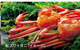
紅ズワイガニ(イメージ)