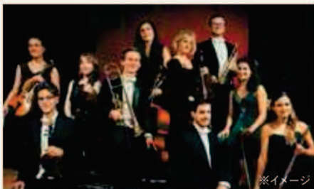
[Aコース]パイプオルガンコンサート(リンツ旧大聖堂) ウィーン・フィルメンバー四重奏コンサート(船内)

本年限りの特別企画として、各クルーズごとに寄港地での貸切コンサートや、セレナーデ船内に演奏家を招いての船上コンサートを開催します。 優雅に響く音楽の調べをゆったりとお楽しみください。