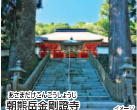
あさまだけごんざうしより 朝熊岳金剛證寺