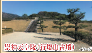
崇神天皇陵(行燈山古墳)

奈良盆地の東にそびえる峰々の山麓を南北に通じる、日本最古の官道が山の辺の道です。東海自然歩道のハイキングコースとして整備されており、周囲には道とともにある由緒ある寺社・仏閣、古から存在し続ける多数の古墳群、季節とともに移ろう花々や自然など、非常に多くの見どころがあります。