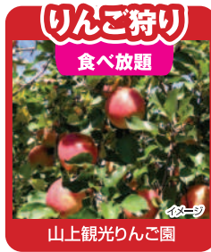
りんご狩り 食べ放題

比婆山の選拜所として信仰を集めた熊野神社の社叢は、100本以上の老杉から成ります。中には樹齢が千年を超えるものもあり、そのうち11本が広島県の天然記念物に指定されています。神社を守るように数十本の杉の大木が天に向かってそびえる様は圧巻です。