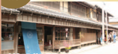
東城の町並み散策

東城町に400年以上続く、伝統ある文化行事をたっぷり見学。大名行列や迫力のある武者行列、かわいらしい華童子の姿をご覧ください。