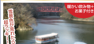
帝釈峡遊覧船 こたつ船