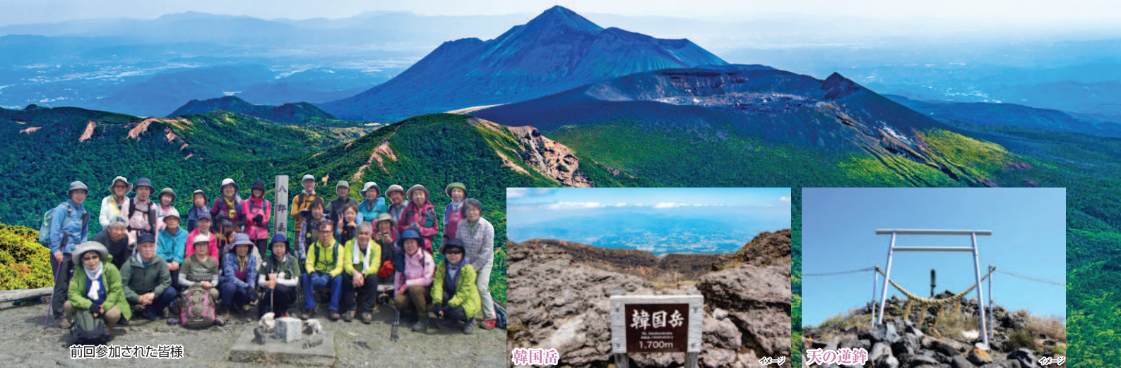
前回参加された皆様