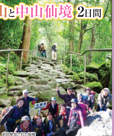
前回参加された皆様