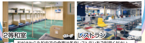
2等和室 レストラン おがさわら丸船内での食事は各自レストランをご利用ください。

本土と小笠原を結ぶ唯一の交通手段です。東京・竹芝港～父島・二見港を片道約24時間で結びます。横揺れ防止装置を装備し、揺れを大幅に軽減しています。快適な船旅をお過ごしください。