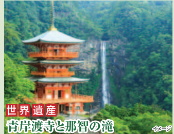
世界遺産 青岸渡寺と那智の滝