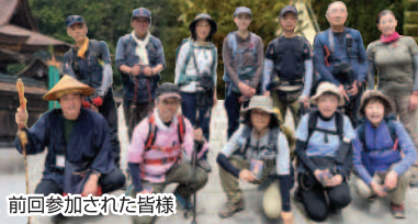
前回参加された皆様