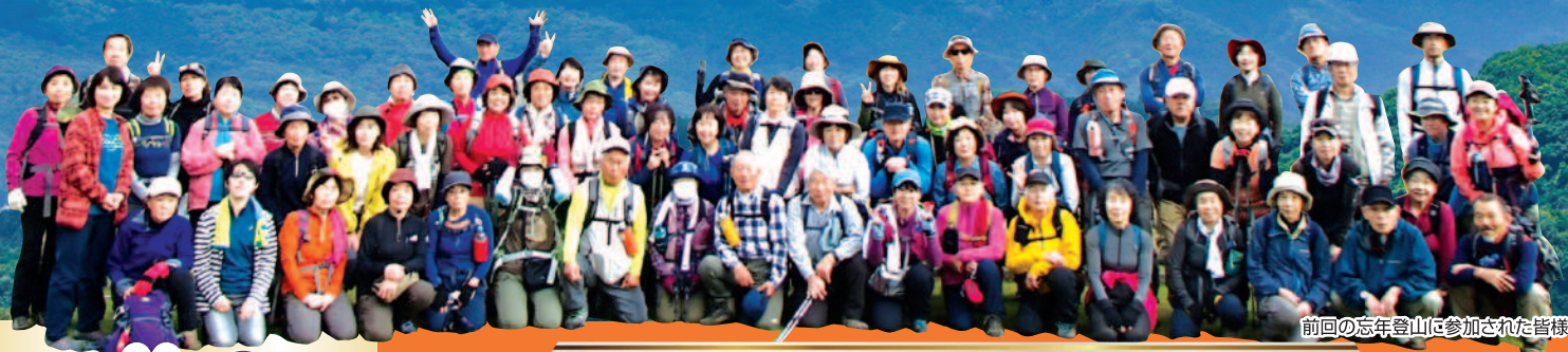
前回の忘年登山に参加された皆様