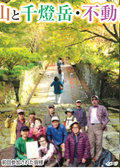
前回参加された皆様