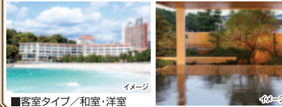
客室タイプ/和室・洋室

白浜ビーチのすぐ目の前に位置し、温泉と魚料理を中心とした会席料理が自慢のホテルです。