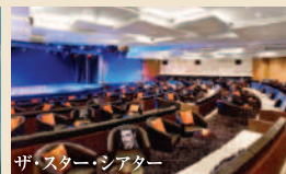
ザ・スター・シアター