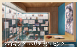
バイキング・ヘリテージ・センター