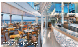
アクアビットテラス