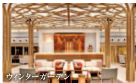
ウィンターガーデン