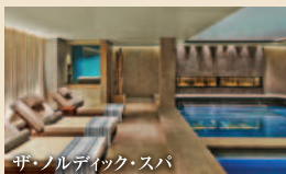
ザ・ノルディック・スパ