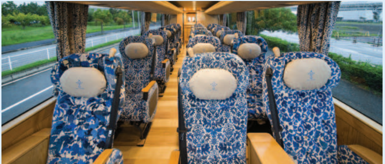
木の質感を至る所に感じられる車内は、1名掛けと2名掛けシートを6列に配置した18名乗り仕様。シートピッチは1,050mm、優しく体を包み込むゆったりとした座り心地です。

乗った瞬間から感動が始まる 『YUI PRIMA』 おもてなしの心が詰まった 上質な空間がここにあります。