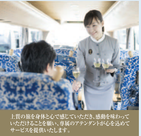
上質の旅を身体と心で感じていただき、感動を味わっていただけることを願い、専属のアテンダントが心を込めてサービスを提供いたします。