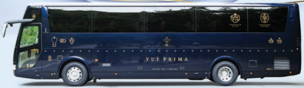
クラシックを基調とした上品なデザイン。濃紺色にメタリックを通常よりも多く配合。