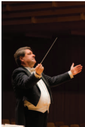
指揮・ヴァイオリン ヨハネス・ヴィルトナー