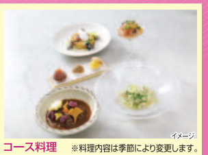
コース料理 ※料理内容は季節により変更します。

優雅な空間で、前菜・お魚料理・お肉料理・スイーツ・ミニスイーツからなるコース料理をご堪能ください。コースの素材は九州各地の質の高いものを中心に使用し、器は九州の職人たちが「或る列車」のために特別に制作したオリジナルです。非日常感あふれる贅沢な時間を演出します。