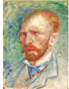
〈自画像〉1887年4月-6月、油彩・厚紙、32.4x24cm クレラー=ミュラー美術館

フィンセント・ファン・ゴッホ(1853-1890)のコレクションで世界的に有名なオランダのクレラー=ミュラー美術館が所蔵するファン・ゴッホの優品約60点などからなる展覧会です。ゴッホの名作(夜のカフェテラス(フォルム広場))(1888年・油彩)が、約20年ぶりに来日します。またモネやルノワールなど、同時代の印象派などの作品と共に展示を行います。 ※学芸員の解説は付きません。