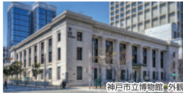
神戸市立博物館 外観