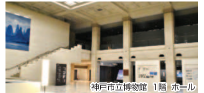
神戸市立博物館 1階 ホール