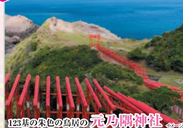
123基の朱色の鳥居の元乃隅神社