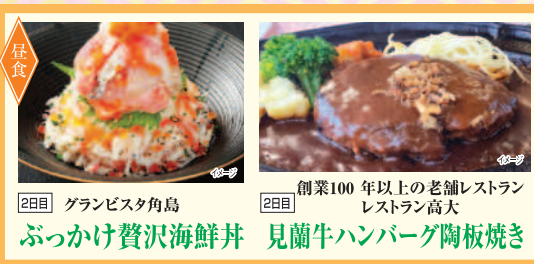
2日目 グランビスタ角島 ぶっかけ贅沢海鮮丼 創業100年以上の老舗レストラン レストラン高大 見蘭牛ハンバーグ陶板焼き