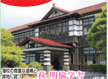
藩校の貴重な遺構と跡地に建つ 萩 明倫学舎