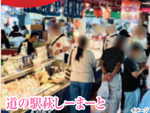
道の駅秋しーまーと