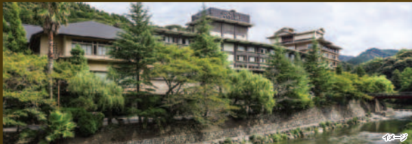
■客室タイプ / 和室・洋室

流れる水音に心とむせせらぎの湯や、陽光がやさしくそそぐ「こもれびの湯」など、四季を感じる湯処が疲れた身体を癒やします。夕食は海の幸、山の幸など旬の食材を盛り込んだ会席をご賞味ください。