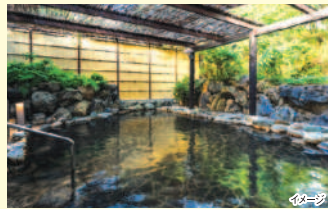
客室タイプ/洋室または和室

瀬戸内海国立公園内に位置。鳴門海峡を見渡す明るいパステルカラーの客室は全室オーシャンビュー。美肌効果が期待できる白濁の湯「うずしお温泉 雲の湯」を源泉とした露天風呂を完備しています。