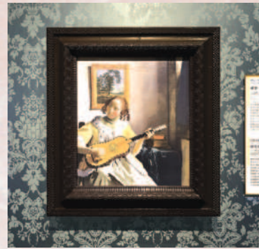
写真は大塚国際美術館の展示作品を撮影したものです