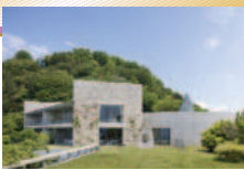
ベネッセハウスミュージアム

安藤忠雄設計の「ベネッセハウスミュージアム」は、「自然・建築・アートの共生」をコンセプトに1992年に開館。大きな開口部から島の自然を内部へと導き入れる構造の建物です。収蔵作品の展示に加え、アーティストたちがその場所のために制作した作品が恒久設置されています。