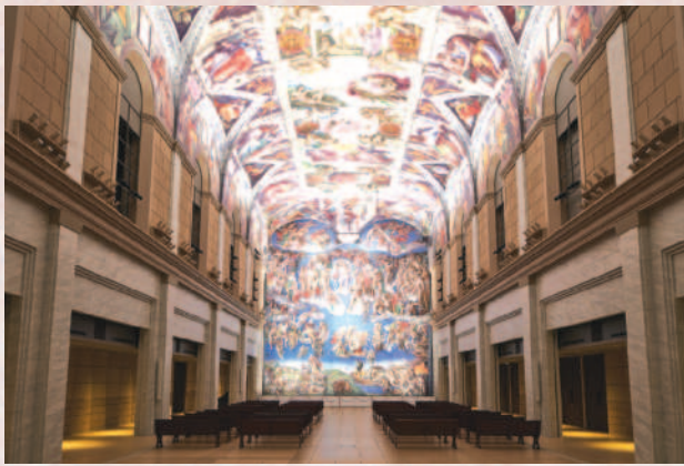
写真は大塚国際美術館の展示作品を撮影したものです

約4kmに及び鑑賞ルートには、世界26カ国190余の美術館が所蔵する約1,000点の世界の名画が、特殊技術によって陶板で原寸大に再現し展示されています。古代遺跡や礼拝堂を現地の空間そのままに再現した展示や、ミケランジェロ、レオナルド・ダ・ヴィンチ、モネ、ゴッホ、ピカソなどの名画など、日本に居ながらにして世界の美術館が体験できます。