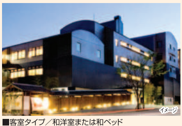
客室タイプ/和洋室または和ベッド