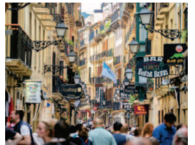
中世から巡礼の中継地や貿易の町として栄えたサンセバスチャン(イメージ)

エコノミークラス利用 ¥658,000 ビジネスクラス利用 ¥1,338,000 1名室利用追加代金 ¥95,000