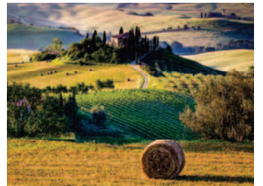
トスカーナの風景(イメージ)

エコノミークラス利用 ¥748,000 ビジネスクラス利用 ¥1,428,000 1名室利用追加代金 ¥110,000