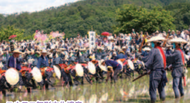
ユネスコ無形文化遺産 壬生の花田植 雨天決行

飾り牛による代掻きの後、太鼓や笛などの囃子に合わせてそらの着物で着飾った早乙女が早苗を植える五穀豊穡を祈る伝統行事です。毎年十頭を超える飾り牛が出場し、百人に迫る規模によって華麗な田園絵巻が繰り広げられます。