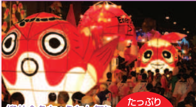
柳井金魚ちょうちん祭り たっぶり3時間滞在

「金魚ねぶた」が祭りの会場を堂々と、時には荒々しく練り歩きます。金魚ちょうちんから洩れるほのかな灯りが白壁の町並みを照らす光景はとても幻想的です。