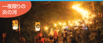
大山寺・大山夏山開き神事 たいまつ行列