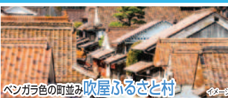
ペンガラ色の町並み 吹屋ふるさと村

松明(たいまつ)を手にした約1,200人が石畳の参道を練り歩く「たいまつ行列」が行われ、夜空を彩る炎の川のような光景が見られます。