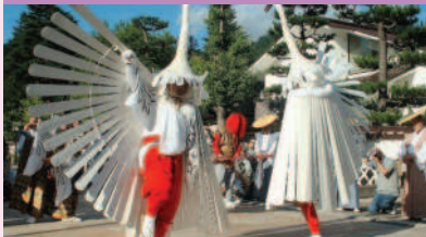
重要無形民俗文化財 津和野の鷺舞神事

津和野の弥栄神社に伝わる古典芸能神事です。城下町に響く鐘の音と、優雅な白鷺の舞をご覧ください。同じ日に披露されるかわいらしい衣装と舞で町内を練り歩く地元小学生たちによる「小鷺踊り」も必見です。