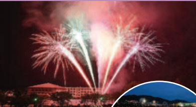
吉舎ふれあい祭り

馬洗川に色とりどりの大小約5千個の灯ろうに灯りがともり、会場は幻想的な光の世界になります。祭りのフィナーレには、約2000発の花火が打ちあがります。