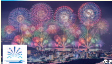
2026松江水郷祭湖上花火大会

宍道湖の広大な湖面を舞台に、約1万発以上もの花火が打ち上がる西日本最大級のイベントです。大迫力のスターマインや、湖面へ放射状に広がる「垂れ幕下がり」の美しさ、そして街全体が祭りモードに包まれます。宍道湖に面した花火を間近で体感できる「県立美術館エリア席」にて観覧いただけます。