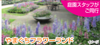
やまぐちフラワーランド

2024年12月に国連教育科学文化機関(ユネスコ)本部で創設された建築賞ベルサイユ賞Prix Versaillesの「世界で最も美しい美術館」に選ばれました。