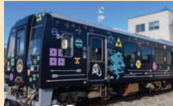
井原鉄道 貸切 乗車 戦国列車

車内では戦国武将によるちよっとしたパフォーマンスタイムや、井原鉄道の沿線に点在する山城の解説を聞きながら、地酒をお楽しみいただけます。