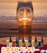
出雲多岐ブルワリー

地域の魅力を五感で味わえるクラフトビール醸造所です。多岐町特産のいちじくやヤマモモなど地元食材を活かした個性豊かなビールは、小規模醸造ならではの丁寧な仕込みにより、香りやコクを大切に「ゆっくり楽しむビール」として評価されています。