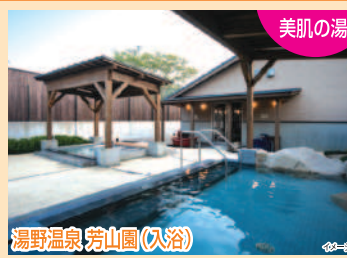
湯野温泉 芳山園(入浴)