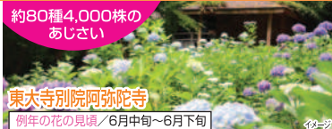
東大寺別院阿彌陀寺 例年の花の見頃/6月中旬~6月下旬