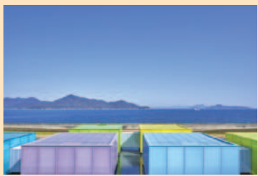
下瀬美術館

2024年12月に国連教育科学文化機関(ユネスコ)本部で創設された建築賞ベルサイユ賞Prix Versaillesの「世界で最も美しい美術館」に選ばれました。