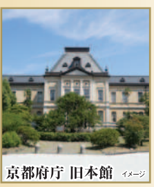
京都府庁 旧本館 イメージ

大雲院 祇園閣 1587年に織田信長・信忠父子の菩提を弔う為に創建された寺院。境内には、高さ36m3階建ての祇園祭の鉦をモチーフにし昭和初期の名建築として知られる祇園閣(国登録有形文化財)があり、特別公開の内部をご覧ください。同時に本堂では豊臣秀吉や織田信長など武将ゆかりの寺宝も特別展示されます。