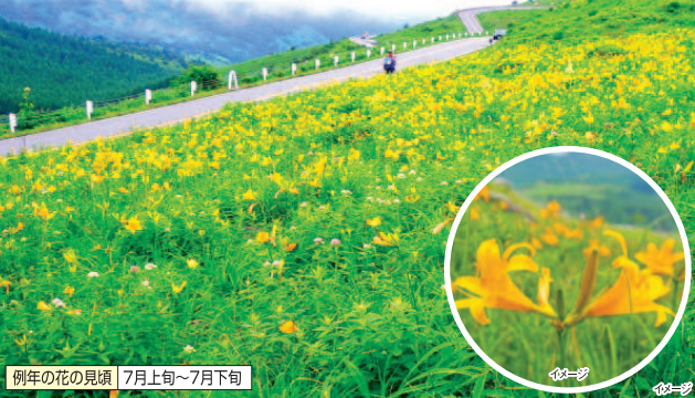
例年の花の見頃 7月上旬~7月下旬