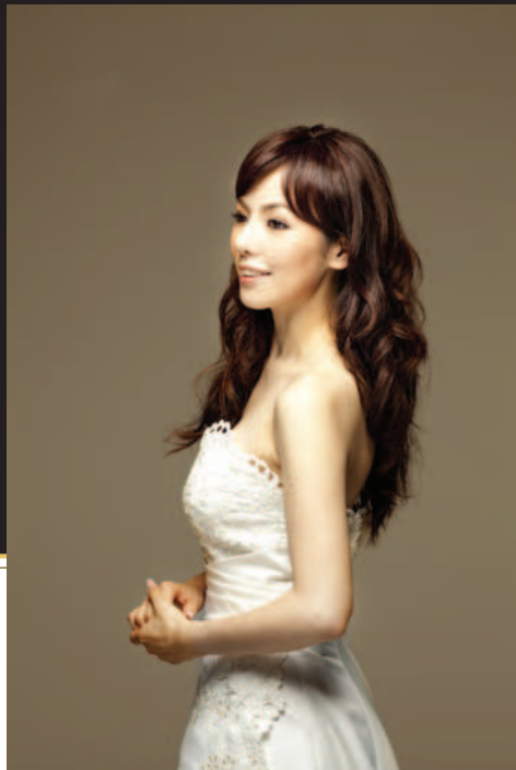
ソプラノ 森 麻季氏