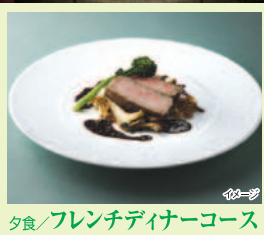
夕食/フレンチディナーコース