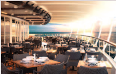
テラスレストラン八重