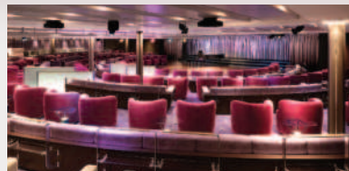
オーシャンステージ

多彩な演目を毎晩上映。連泊でも新鮮な感動が続く臨場感あふれる特別なひとときをお過ごしください。