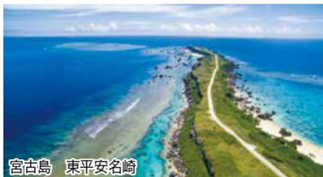
宮古島 東平安名崎