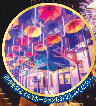
街中を彩るイルミネーションもお楽しみください。